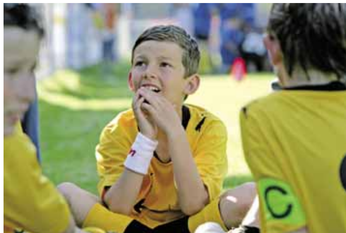
OČEKÁVÁNÍ před zápasem. Mladí fotbalisté bojují i s emocemi.

Týmům ale svítla naděje v souvislosti s porodním boomem minulých let. Děti ale ještě musejí vyrůst, než začnou podávat výkony.