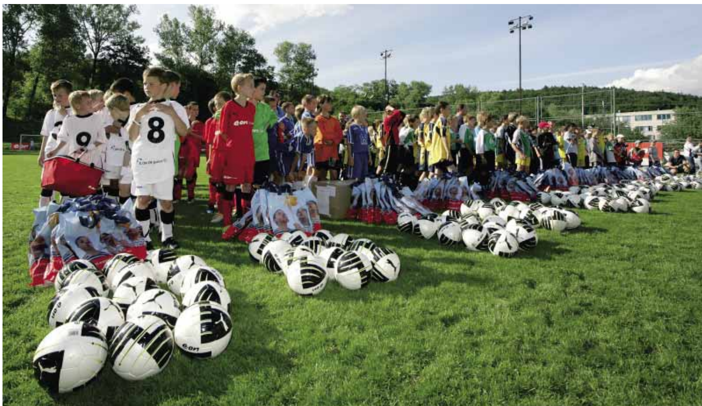
KAŽDÝ HRÁČ dostal fotbalový míč a další dárky.

Míče patřily dětem. „Míče jsou kluků, ale normálně s nimi chodí na trénink. Dresy vypadají skutečně bezvadně, jsou kvalitní a budeme je používat v rámci našeho klubu,“ řekl jeden z trenérů po turnaji.