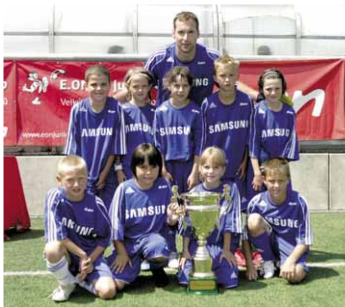
NEJLEPŠÍ HRÁČI E.ON JC po společném tréninku s Petrem Čechem.