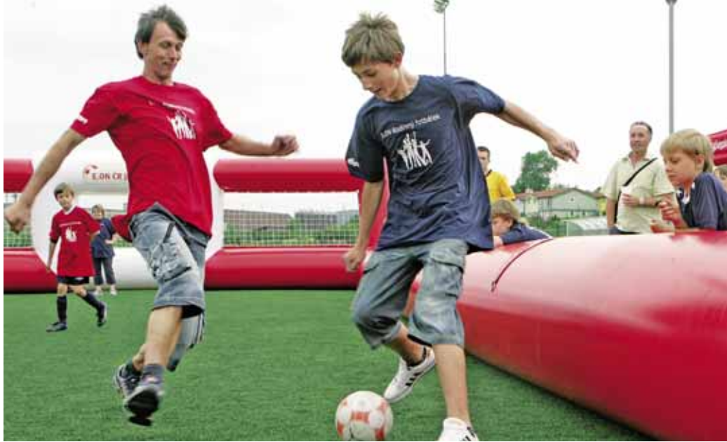
RODINNÝ FOTBÁLEK se hraje na speciálním hřišti.

„Prvním a nejdůležitějším hlediskem rodinného fotbálku je čas, který lidé stráví u nás na hřišti. Zjistili jsme, že i když lidé mají například zahradu nebo park hned vedle domu, téměř nikdo z nich se nedostane k tomu, aby si zahrál fotbálek s dětmi, manželkou, otcem či babičkou. Tuto možnost jsme tedy nabídli,“ vysvětlil Pagač.