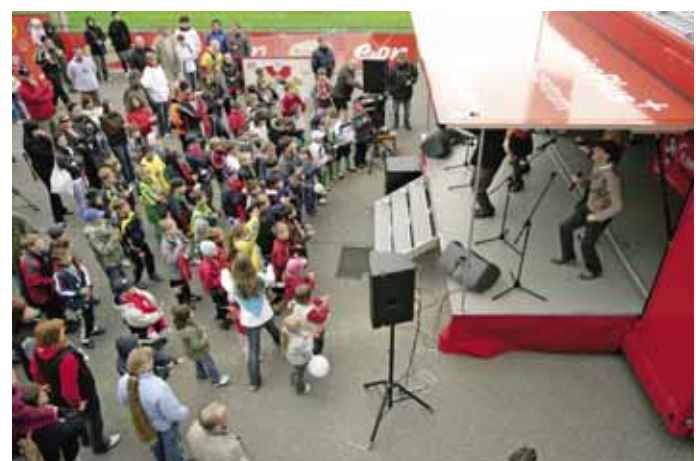
KONCERTY ZAUJALY jak hráče, tak i diváky, pro které bylo vystoupení zpěváků z českých muzikálů zajímavým zpestřením.