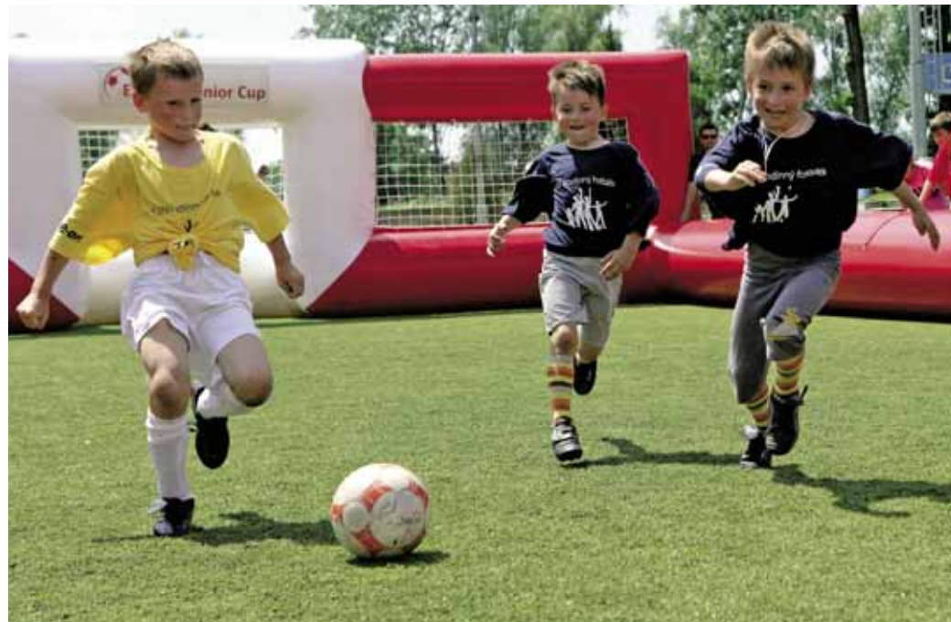
KOUZLU RODINNÉHO FOTBÁLKU propadli naprosto všichni.

„Ani mně nevadí, že jsem se nešel koupat. Celý den jsem si užil,“ poznamenal jeden z hráčů poté, co turnaj skončil.