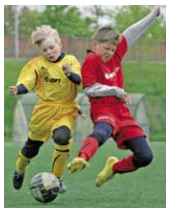
O DRAMATICKÉ MOMENTY nebyla nouze.

Pro zmíněné kluby to znamenalo vyloučení z turnaje. SK Líšeň, která regionální kolo vyhrála, musela přepustit první místo druhému Apos Blansko. Kvůli diskvalifikaci se pak posunuly týmy, které původně hrály o třetí místo. Druhý tak skončil vítěz z tohoto duelu FC Forman Boskovice a třetí SK Slavkov u Brna, který tak dosáhl na výhru pro první tři umístěné týmy – kompletní sadu dresů.