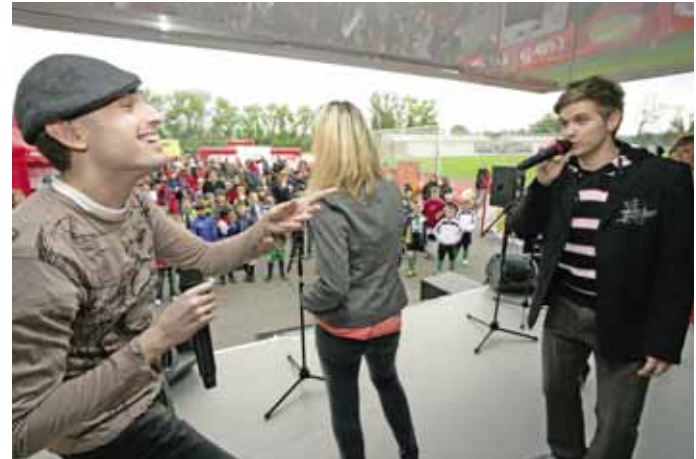
SOUČÁSTÍ DOPROVODNÉHO PROGRAMU byla vystoupení interpretů z oblíbeného Muzikálu ze střední.