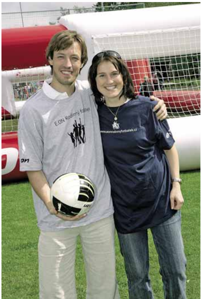
NIKOLA SUDOVÁ a MARTIN KOUKAL byli hlavními sportovními hvězdami letošního ročníku E.ON Junior Cupu. Děti se mohly s nimi nejen vyfotografovat, ale i získat autogram. Sportovci si turnaj pochvalovali a ocenili, že energetická společnost E.ON podporuje mládežnický sport.

E.ON Junior Cup letos zažila již podruhé. „Líbí se mi hlavně myšlenka. Turnaj hodně pro kluky znamená a oceňuji, že je podporují i rodiče, jak je vidět z tribun,“ konstatovala Sudová a poukázala, že někteří rodiče zápasy prožívají emotivněji než děti. „Každopádně je to skvělé. Nicméně i oni by si měli uvědomit, že jde hlavně o radost ze sportu,“ dodala sympatická Sudová.