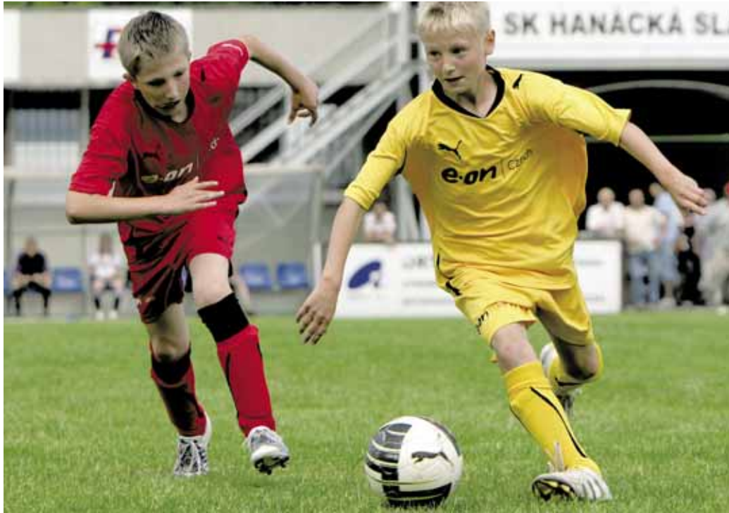
VE FINÁLE regionálního kola v Kroměříži hrály 1. SK Prostějov a domácí SK Hanácká Slavia.

Letošní šestý ročník začal 9. května v Hluboké nad Vltavou. Série dvanácti regionálních kol skončila 20. června v Praze. „Do bojů v regionálních kolech nastoupilo 144 týmů a na dva tisíce malých fotbalistů,“ upozornil Pagač.