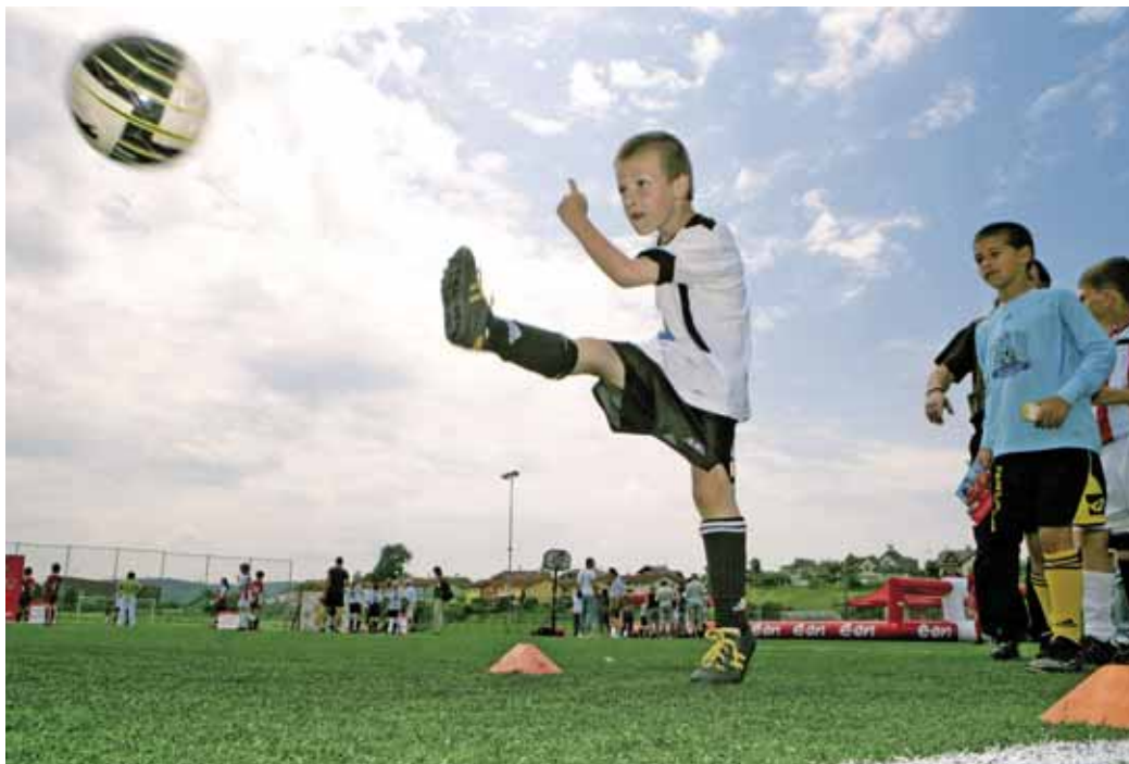
HRÁČE ZAUJALY dovednostní fotbalové soutěže. Na snímku fotbalista střílí na přesnost.